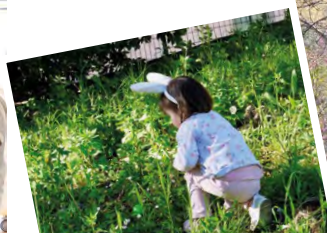
CHASSE AUX OEUFS DU COF AU PLAN DE GRASSE