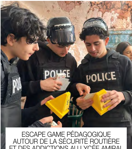
ESCAPE GAME PÉDAGOGIQUE AUTOUR DE LA SÉCURITÉ ROUTIÈRE ET DES ADDICTIONS AU LYCÉE AMIRAL DE GRASSE PAR L'ASSOCIATION G-ADDICTION