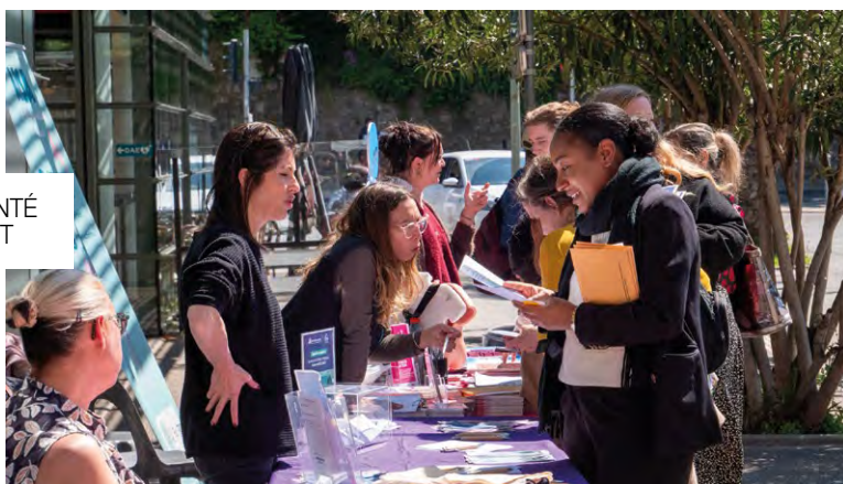
FORUM SANTÉ ITINÉRANT