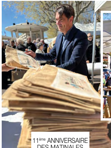
11 ème ANNIVERSAIRE DES MATINALES