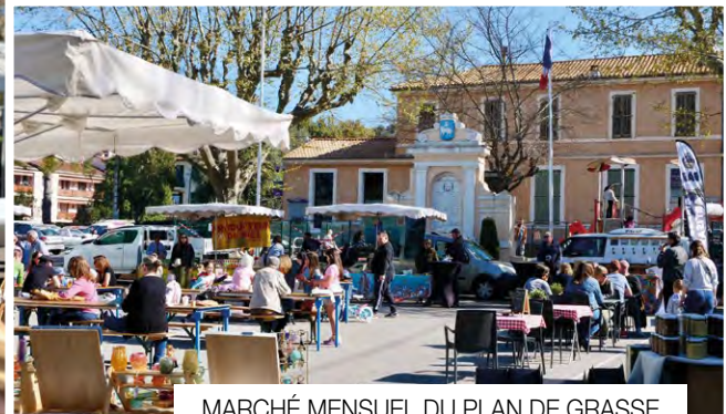
MARCHÉ MENSUEL DU PLAN DE GRASSE