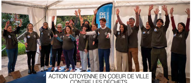
ACTION CITOYENNE EN CŒUR DE VILLE CONTRE LES DÉCHETS