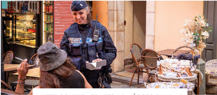
LUTTE CONTRE LES JETS DE MÉGOTS EN VILLE