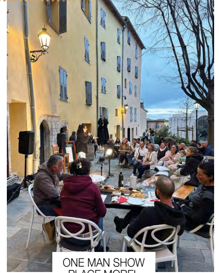
ONE MAN SHOW PLACE MOREL