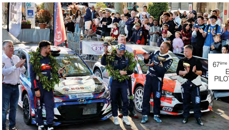
67 ème RALLYE FLEURS ET PARFUMS PILOTES GAGNANTS