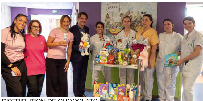
DISTRIBUTION DE CHOCOLATS DE PÂQUES - CHU DE GRASSE