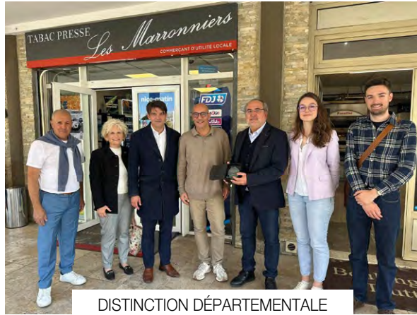
DISTINCTION DÉPARTEMENTALE POUR LE TABAC DES MARRONNIERS