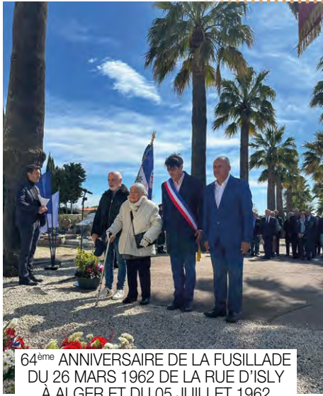
64 ème ANNIVERSAIRE DE LA FUSILLADE DU 26 MARS 1962 DE LA RUE D'ISLY À ALGER ET DU 05 JUILLET 1962 À ORAN