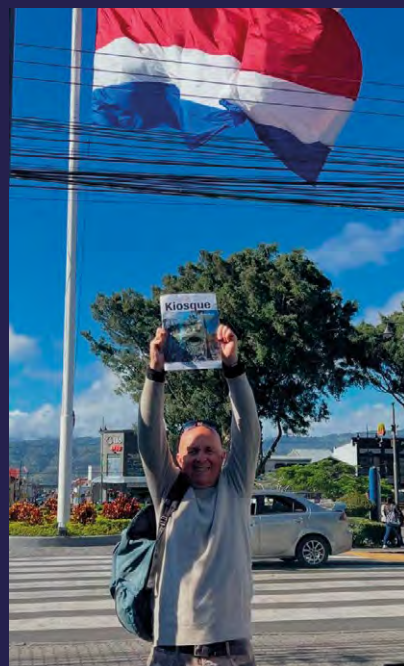
Kiosque au Costa Rica