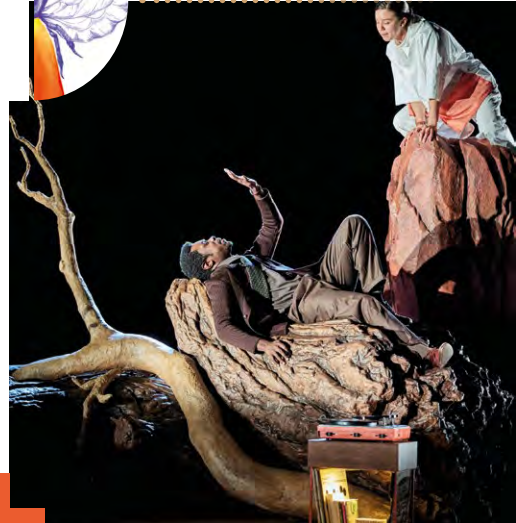
La Distance