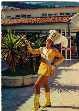
La Majorette, Exclusivité Monoprix © Grasse, Coll. Bibliothèque

Archives Municipales de Grasse Domaine des Olivettes - 10, av. De Croisset 04 97 05 58 40