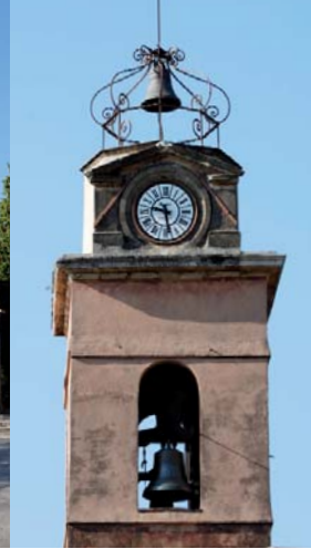
Quartier Saint-Laurent, clocher