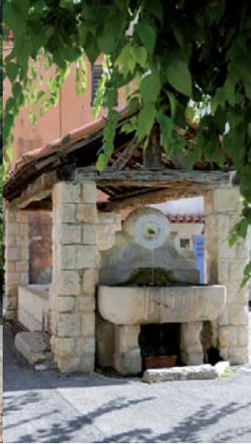
Quartier Saint-Laurent, lavoir