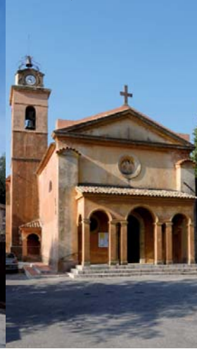
Quartier Saint-Laurent, église