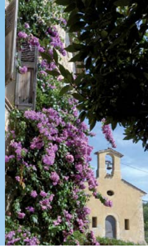
Quartier des Roumégons, chapelle Saint-Antoine

Magagnosc est l'un des trois hameaux de Grasse avec Plascassier et Le Plan. Il est situé au nord-est de la commune de Grasse. Magagnosc se compose de plusieurs quartiers essaimés de part et d'autre de deux anciennes voies de communications est/ouest comme en témoigne le cadastre napoléonien (c.1910). Le long du « chemin de Grasse à Vence », on trouve les Hautes et les Basses Chauves ainsi que le Thoronet. Plus au sud, bordant le « chemin de Grasse à Chateaufort », on rencontre La Lauve, Saint-Laurent et Les Roumégons. Ces petits quartiers regroupent quelques habitations liées sans doute à l'activité agricole. Le cadastre napoléonien mentionne d'ailleurs la présence d'un ou deux moulins à huile dans chacun d'eux (sauf aux Chauves). L'oléiculture, plus ancienne que la culture florale, a