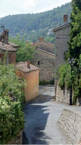
Vue du quartier de La Lauve