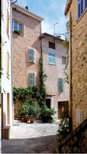
Vue du quartier Saint-Laurent