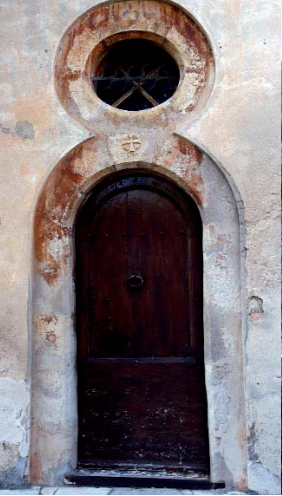
Quartier de La Lauve, porte appareillée en pierre de taille