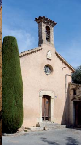
Quartier Saint-Laurent, chapelle des Pénitents blancs