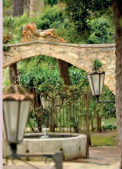
Jardin villa Fragonard