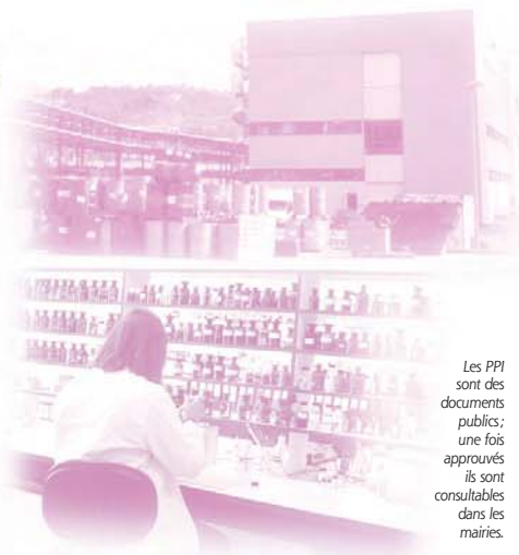
Les PPI sont des documents publics; une fois approuvés ils sont consultables dans les mairies.