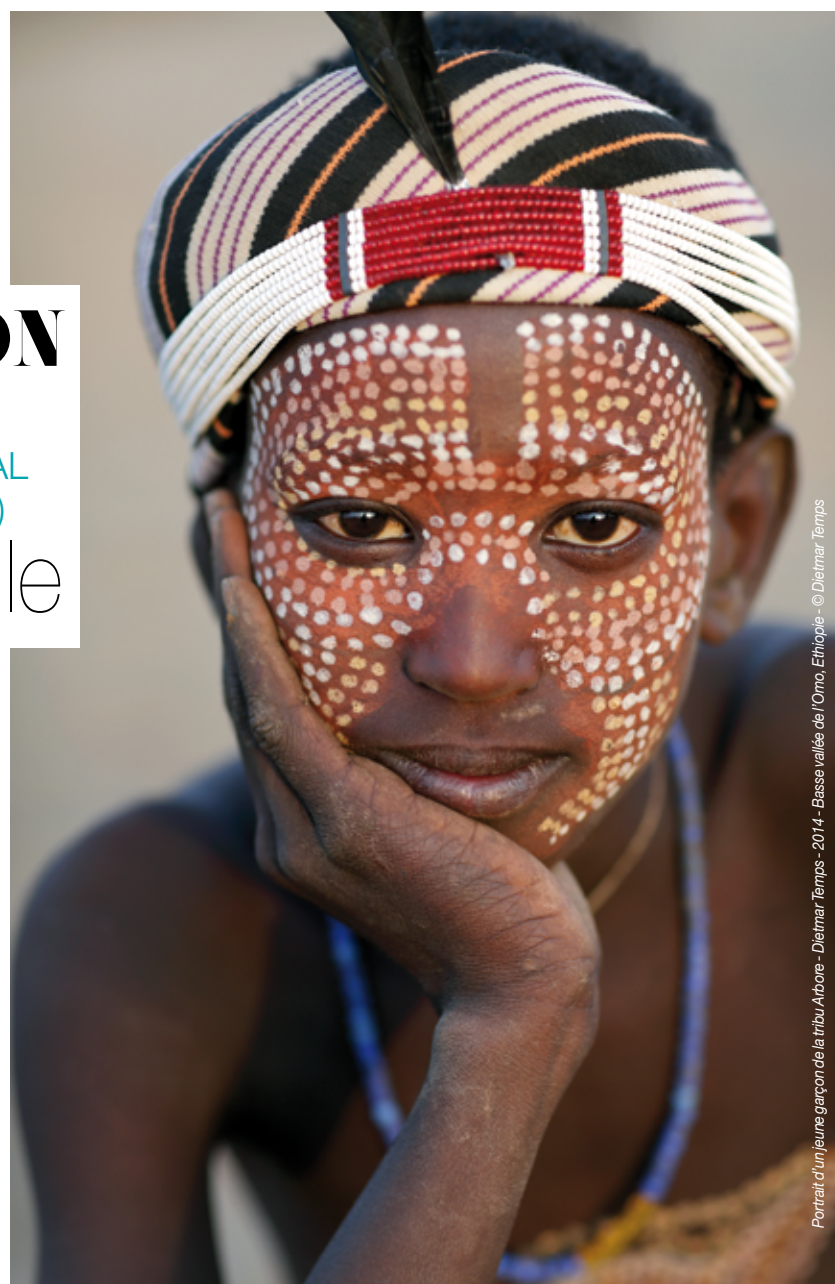
Portrait d'un jeune garçon de la tribu Aibore - Dietmar Temps - 2014 - Basse vallée de l'Omo, Ethiopie

The summer exhibition of the International Perfume Museum (MIP) is in itself an event: a rigorous scientific discourse about universality, the wealth of works exhibited, the quality set design, everything is remarkable and not to be shamed by the other major